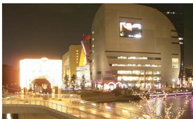
▲冬の風物詩となった「ファンタスティックイルミネーション」。手前に紫川10橋の一つ「水鳥の橋」(鷗外橋)、奥は複合商業施設「リバーウォーク北九州」。