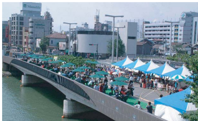
▲紫川10橋の一つ「石の橋」(勝山橋)。公園区域として整備された広い歩道では、まちづくり団体によりオープンカフェが行われ、賑わいを見せている。