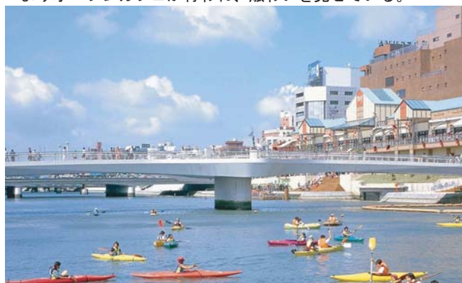
▲水がきれいになった紫川では、カヌーや貸しボート、遊覧船などの水面を活用したイベントが行われている。