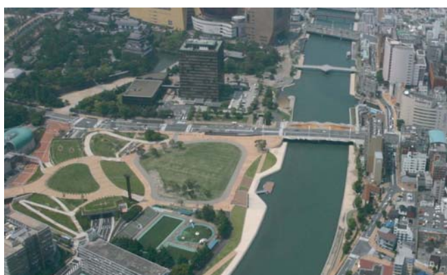
▲市庁舎周辺には、複合商業施設や紫川と一体となった勝山公園大芝生広場が整備された。

こうした取り組みによって、川で分断されていた東西地域に一体感が生まれ、川を中心に回遊性と賑わいが高まっている。