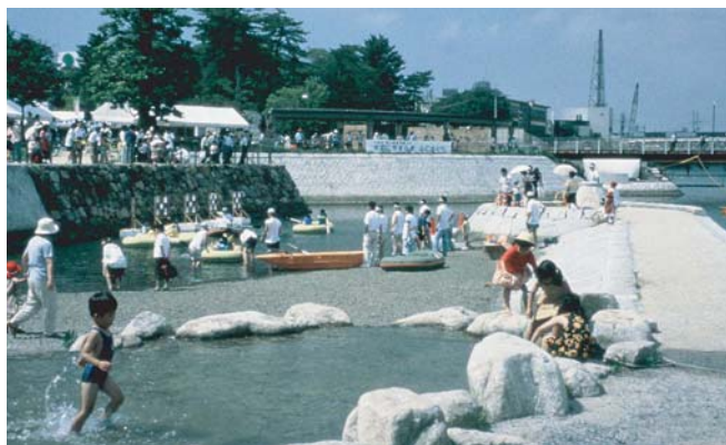
▲市庁舎前の「洲浜ひろば」は、川を活用した行事や子供の水遊びの場として利用されている。